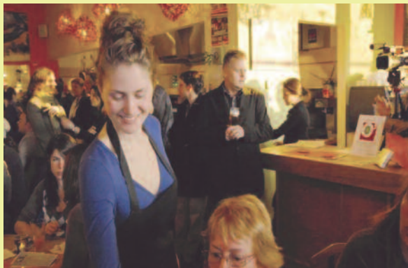
Projet de revitalisation Jarry - 2 e Avenue

Une coopérative d'habitation côtoie le bistro TribuTerre, deux CPE, l'atelier-boutique Vélogik, la Coopérative de solidarité des Cuisines Tibet Libre et le Fonds de développement Emploi-Montréal (FDEM).