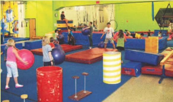
L'École de cirque de Québec

D'une part, la Caisse d'économie solidaire Desjardins vous offre un taux d'intérêt aussi avantageux que celui des autres institutions financières. D'autre part, grâce à votre épargne, la Caisse finance exclusivement des projets et des entreprises qui ont une valeur ajoutée sur les plans social, culturel et environnemental. La Caisse tient à ce que ce financement soit transparent afin que vous sachiez précisément où votre argent est investi.