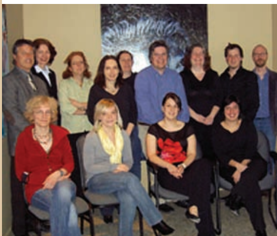
photo: employé-es des Violons du Roy

Les régimes de retraite sont une belle démonstration de la manière dont les employeurs peuvent s'engager socialement, car ils leur permettent d'aider leurs employé-es à s'assurer un niveau de vie décent à la retraite.